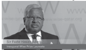
نخستین برنده وایز از بنگلادش