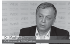
دومین برنده وایز از هندوستان