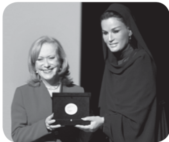
سومین برنده وایز از کلمبیا در کنار خانم موزا بنت ناصر

در همین راستا اجلاس نوآوری جهانی برای آموزش و پرورش ۱ یا وایز ۲ در سال ۲۰۰۹ و با شعار «آموزش آینده را بسازیم» توسط بنیاد قطر برای آموزش، علم تجربی و توسعه جامعه راه اندازی شد. این اجلاس سالانه در پی تشویق بهترین و نوآورانه ترین رویکردهای تازه به آموزش و پرورش از سراسر جهان است. بنیاد قطر یک سازمان غیرانتفاعی خصوصی است که در سال ۱۹۹۵ توسط خانم موزا بنت ناصر بن عبدالله المسند همسر دوم شیخ حمد بن خلیفه آل ثانی امیر قطر تأسیس شده است. وی فردی فعال در آموزش و پرورش قطر است و تا امروز در پروژه‌های توسعه‌ای بین‌المللی هم نقش چشمگیری ایفا کرده است.